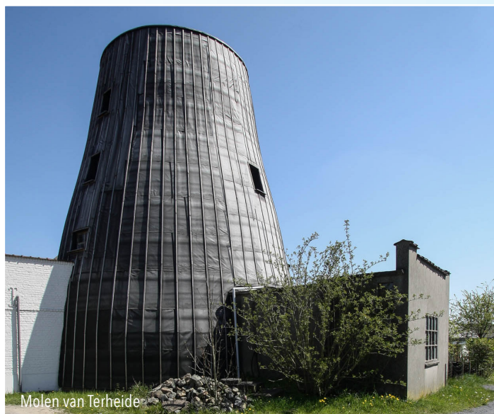
Molen van Terheide

Al in 1410 was er sprake van een molen op deze plaats; hij was toen eigendom van abdij Affligem . In 1786 werd er – op deze hooggelegen plaats in het landschap – een stenen graanwindmolen opgericht waarvan de kap in 1922 definitief verwijderd werd. De molen werd toen gemoderniseerd en er werd niet langer gebruikt gemaakt van windenergie.