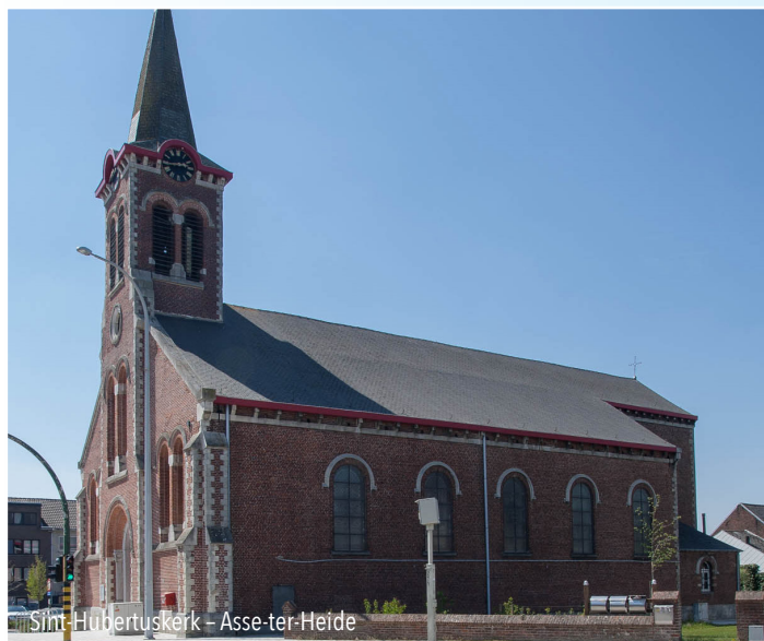
Sint-Hubertuskerk – Asse-ter-Heide

Het beeld van Onze-Lieve-Vrouw met kind is van omstreeks 1700.