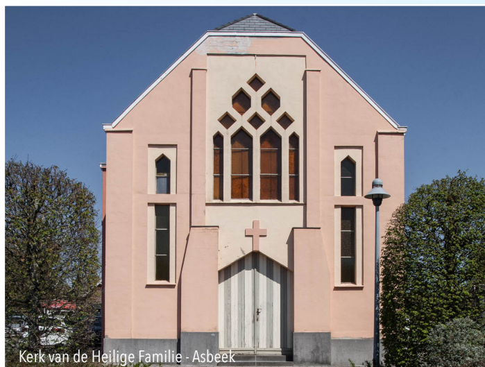
Kerk van de Heilige Familie - Asbeek