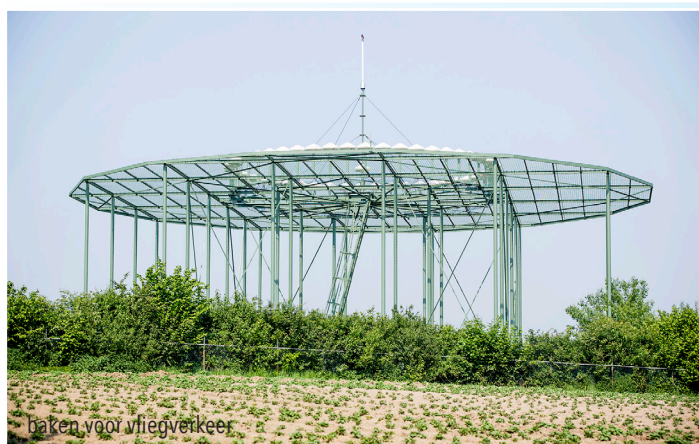
baken voor vliegverkeer

Een radiobaken van het Bestuur der Luchtvaart . Het zendt een signaal uit dat opgepikt wordt door het intern navigatieplatform van het vliegtuig. Door een wereldomvattend netwerk van dergelijke bakens vinden vliegtuigen hun weg door van bakens tot bakens te vliegen.